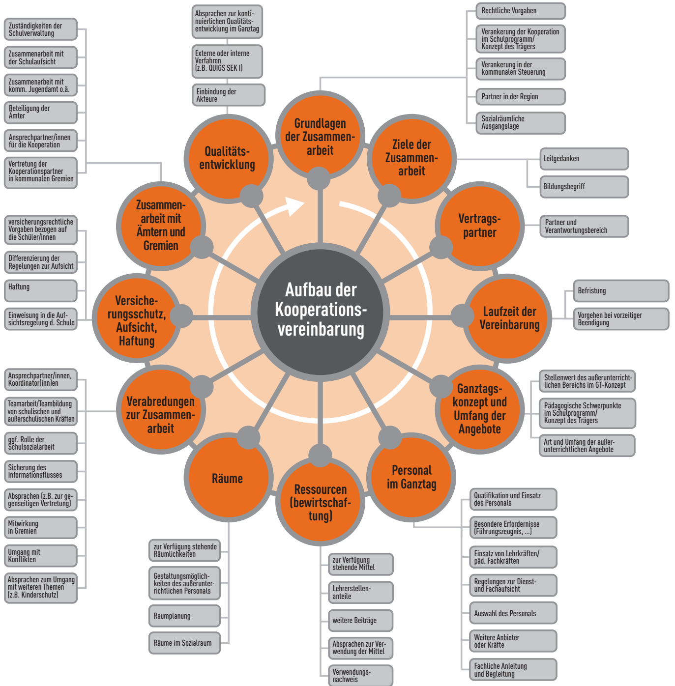
Abb. 2: Zentrale Themenbereiche der Kooperationsvereinbarung