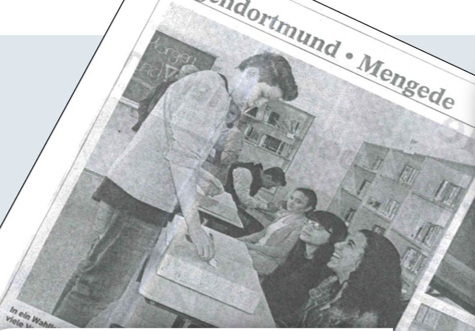
In ein Wahl viele v